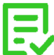
Formulario Web pruebas acceso GS