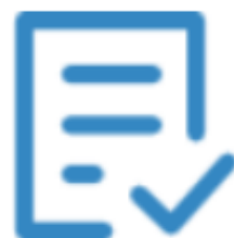
Formulario Web pruebas acceso GM